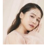
モデルクリエイター・実業家 ゆうこす