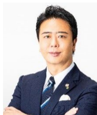
福岡市長 高島 宗一郎