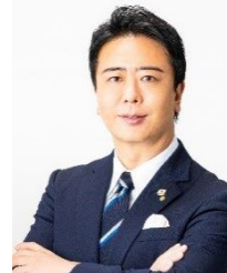
福岡市長 高島 宗一郎