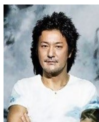
チームラボ代表 猪子 寿之