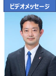
千葉県知事 熊谷 俊人