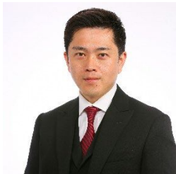
大阪府知事 吉村 洋文