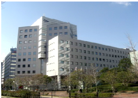
【SRPセンタービル全景】

当ビル1階106号室(295.46㎡) 格安条件にて今すぐ入居可能！ お気軽にお問合せ下さい。