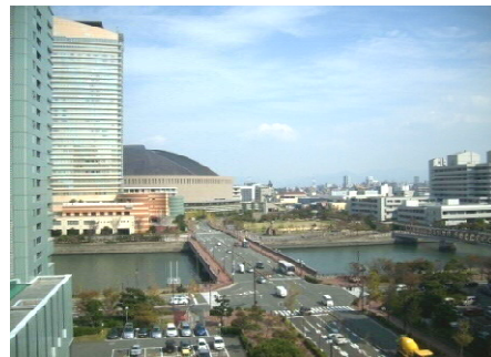
【当ビルより福岡Yahoo! JAPAN TM ・ムを望む】