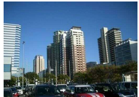
【百道浜居住区マンション群】